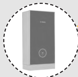
SCALDABAGNO A GAS