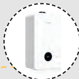
CALDAIE A GAS