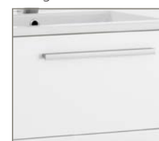
cm L. 80 BIANCO LACCATO LUCIDO/OPACO maniglia cromo