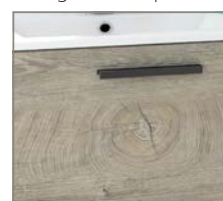
cm L. 60 ROVERE ALASKA maniglia nero opaco